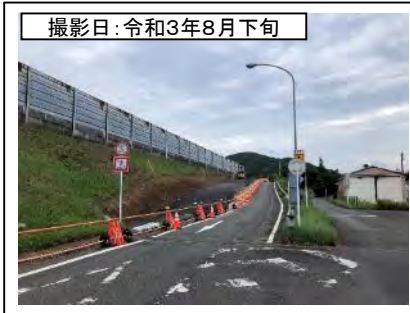
撮影日: 令和3年8月下旬