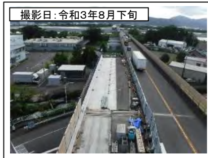
撮影日: 令和3年8月下旬