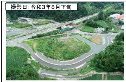
撮影日: 令和3年8月下旬