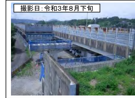
撮影日: 令和3年8月下旬