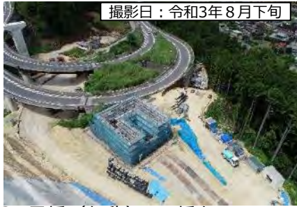
撮影日：令和3年8月下旬