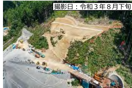
撮影日：令和3年8月下旬