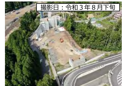
撮影日：令和3年8月下旬