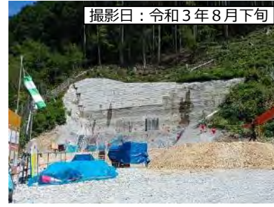
撮影日：令和3年8月下旬