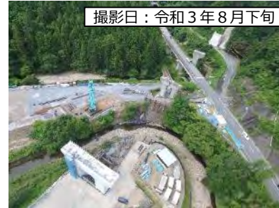
撮影日：令和3年8月下旬