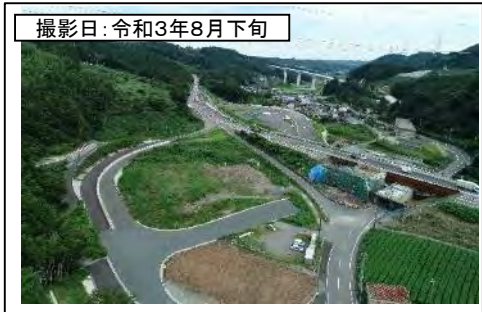
撮影日: 令和3年8月下旬