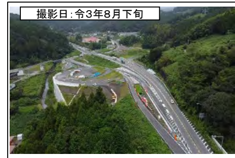
撮影日: 令和3年8月下旬