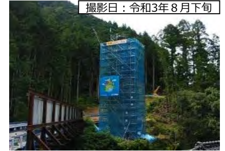
撮影日：令和3年8月下旬