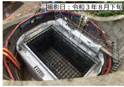
撮影日：令和3年8月下旬