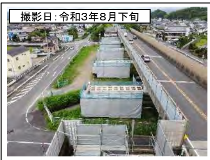
撮影日: 令和3年8月下旬