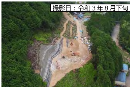
撮影日：令和3年8月下旬