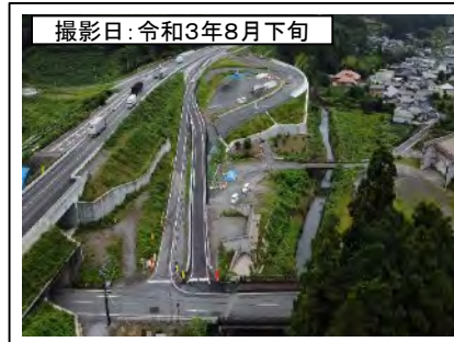
撮影日: 令和3年8月下旬