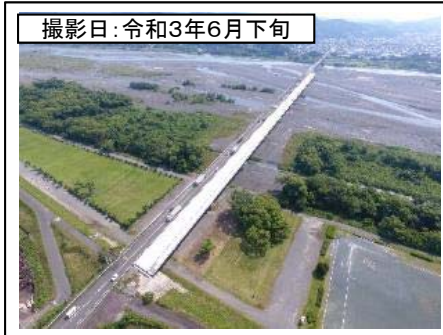
撮影日: 令和3年6月下旬