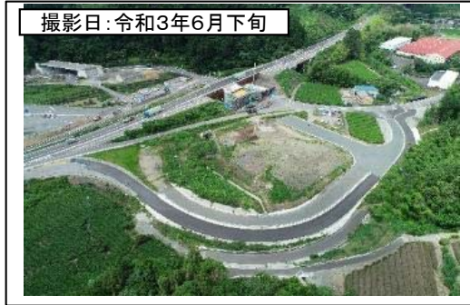
撮影日: 令和3年6月下旬