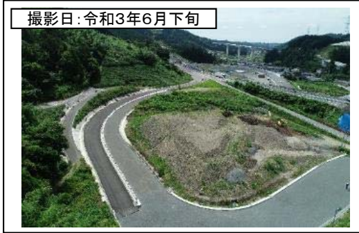
撮影日: 令和3年6月下旬