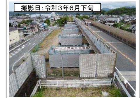
撮影日: 令和3年6月下旬