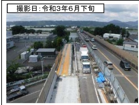
撮影日: 令和3年6月下旬