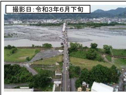
撮影日: 令和3年6月下旬