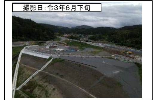
撮影日: 令和3年6月下旬