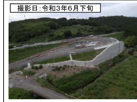
撮影日: 令和3年6月下旬