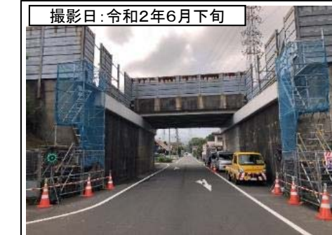
撮影日: 令和2年6月下旬