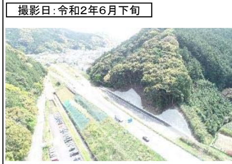
撮影日: 令和2年6月下旬