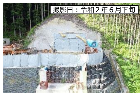
③ 1号トンネル(仮称) 坑口