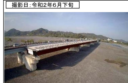
撮影日: 令和2年6月下旬