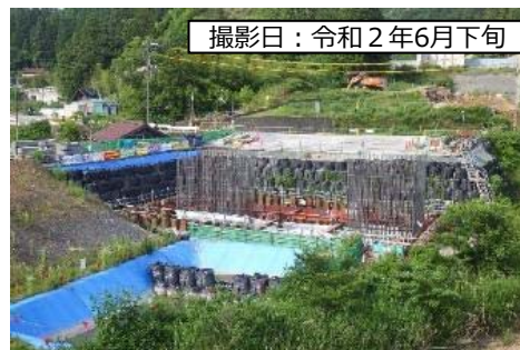
⑦ 1号橋 (仮称) P3橋脚