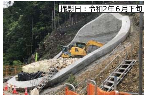
② 8号橋 (仮称)