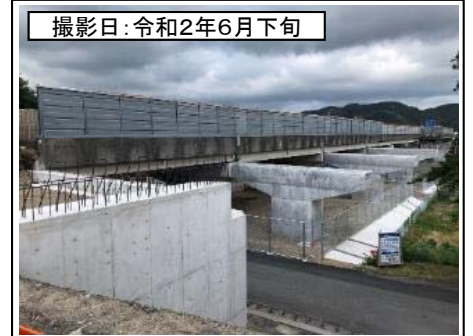
撮影日: 令和2年6月下旬