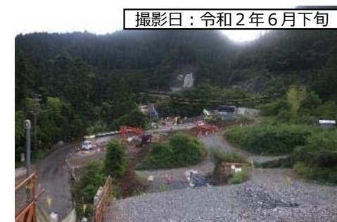
⑧ 1号橋 (仮称) A2橋台