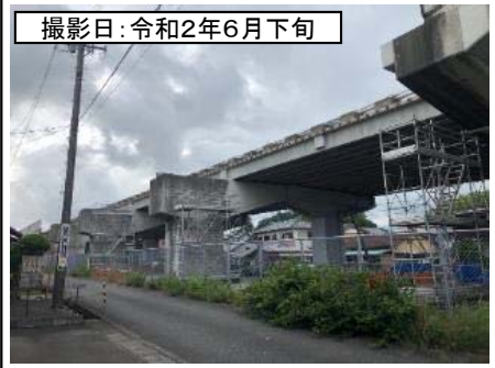
撮影日: 令和2年6月下旬