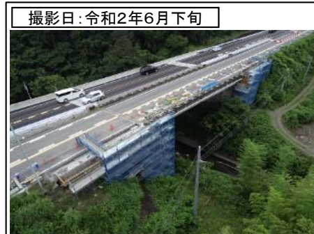
撮影日: 令和2年6月下旬