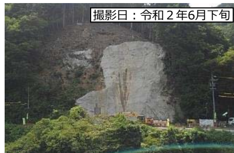
⑥ 1号橋(仮称) A1橋台