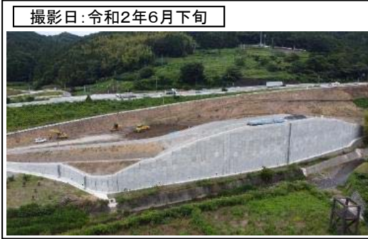
撮影日: 令和2年6月下旬