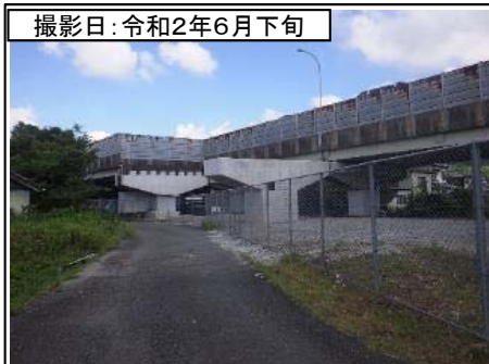
撮影日: 令和2年6月下旬