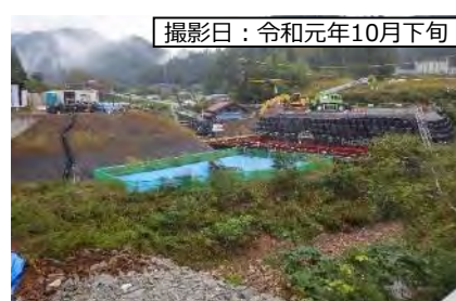
撮影日：令和元年10月下旬