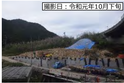
撮影日：令和元年10月下旬