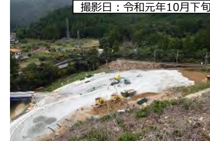
撮影日：令和元年10月下旬