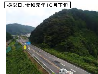
撮影日: 令和元年10月下旬