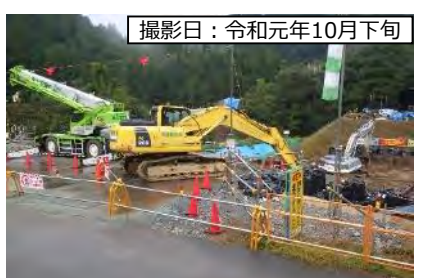
撮影日：令和元年10月下旬