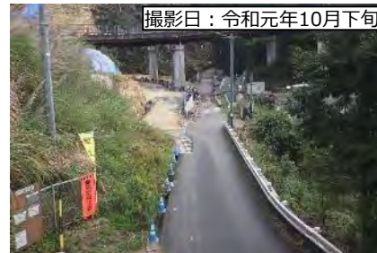
撮影日：令和元年10月下旬