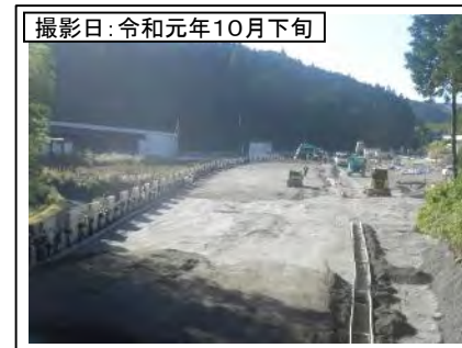
撮影日: 令和元年10月下旬