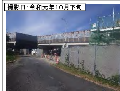
撮影日: 令和元年10月下旬