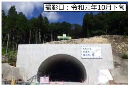
撮影日：令和元年10月下旬