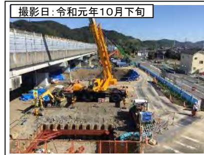
撮影日: 令和元年10月下旬