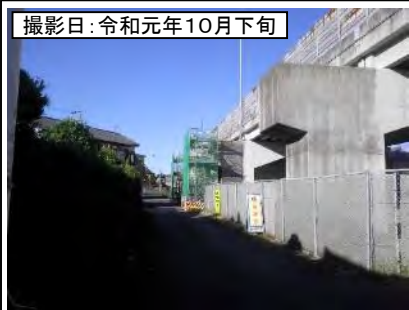
撮影日: 令和元年10月下旬