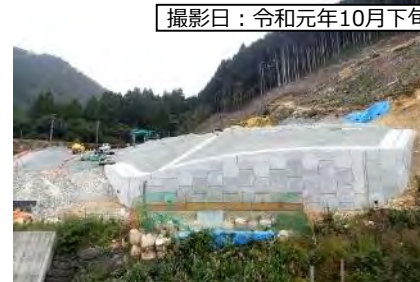
撮影日：令和元年10月下旬