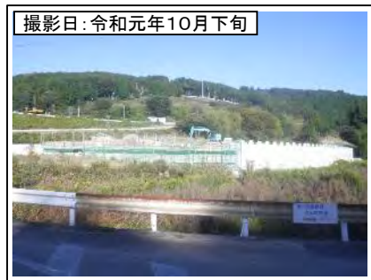
撮影日: 令和元年10月下旬