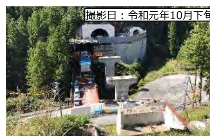
撮影日：令和元年10月下旬