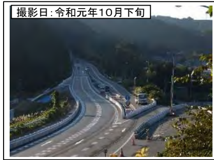
撮影日: 令和元年10月下旬