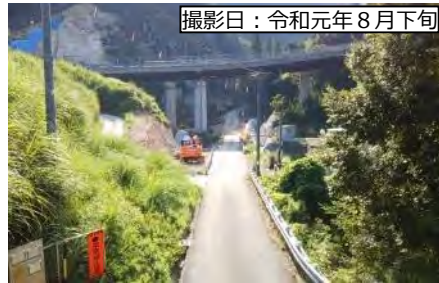
撮影日：令和元年8月下旬