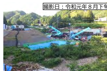
撮影日：令和元年8月下旬