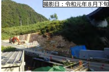
撮影日：令和元年8月下旬