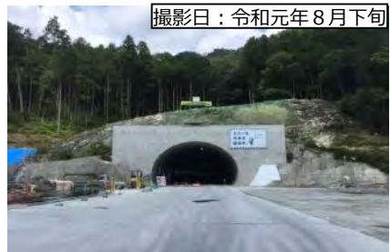
撮影日：令和元年8月下旬