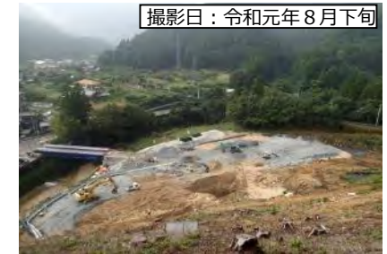
撮影日：令和元年8月下旬