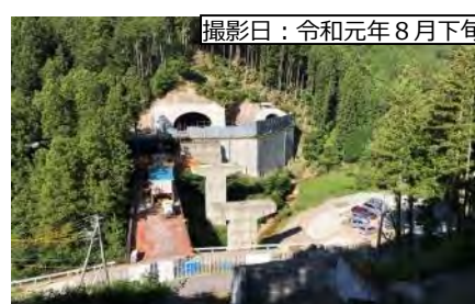
撮影日：令和元年8月下旬