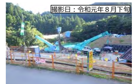
撮影日：令和元年8月下旬