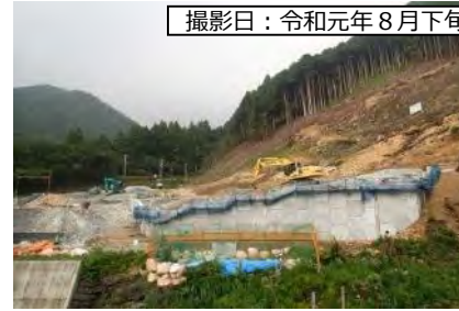
撮影日：令和元年8月下旬