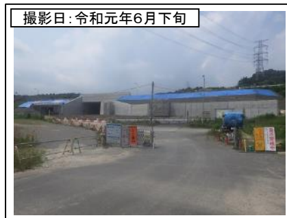
②菊川IC付近(東京方面を望む)