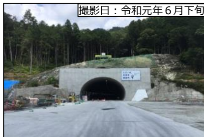
⑤ 3号トンネル(仮称) 新城側坑口