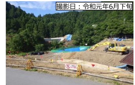
⑧ 1号橋 (仮称)