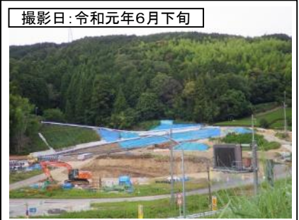
⑤菊川IC付近(東京方面を望む)