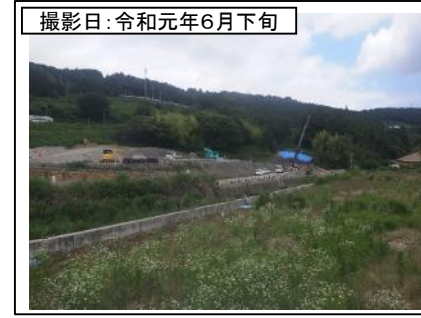
③菊川IC付近(東京方面を望む)