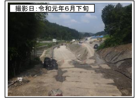
④菊川IC付近(名古屋方面を望む)