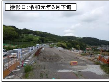
①菊川IC付近(東京方面を望む)