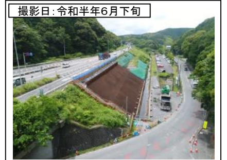
⑧野田IC付近(名古屋方面を望む)