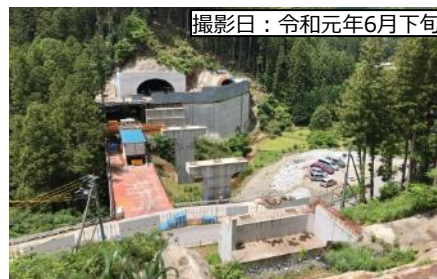
⑥ 3号トンネル(仮称) 東栄側坑口