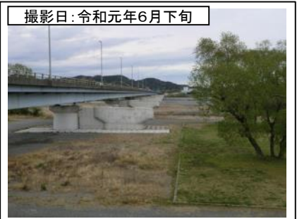
⑦新大井川橋右岸より