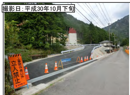
④ 7号橋 (仮称)