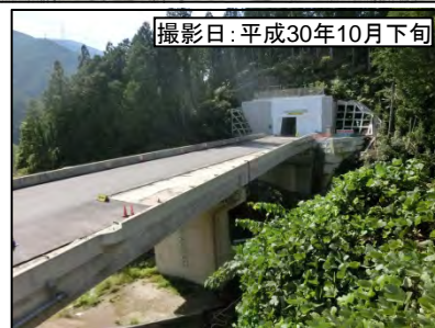
撮影日:平成30年10月下旬