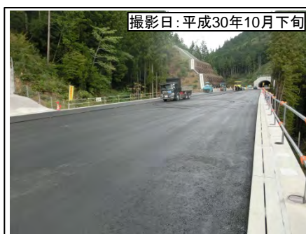
撮影日:平成30年10月下旬