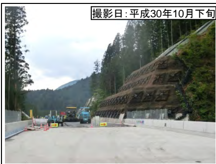
撮影日:平成30年10月下旬