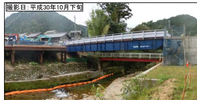
③ 8号橋 (仮称)