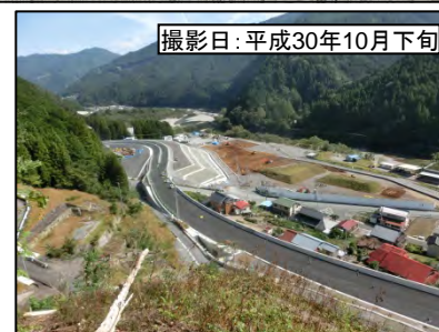
撮影日:平成30年10月下旬