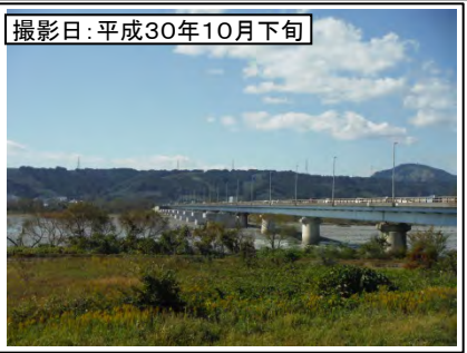
⑥新大井川橋左岸より