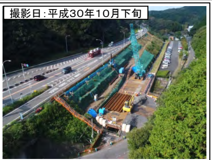
⑦野田IC付近(名古屋方面を望む)