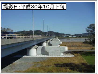
⑤新大井川橋右岸より