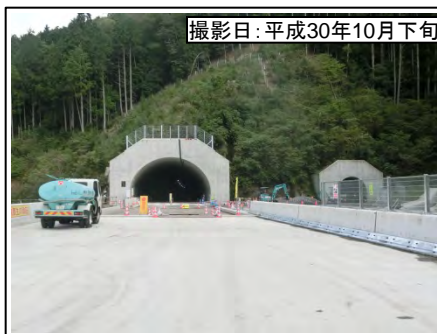
撮影日:平成30年10月下旬