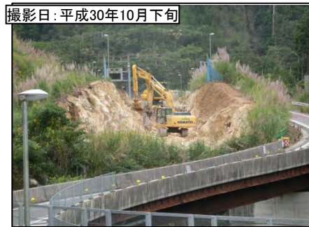
① 9号橋 (仮称)