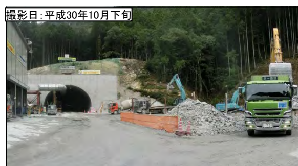
⑤ 3号トンネル新城側