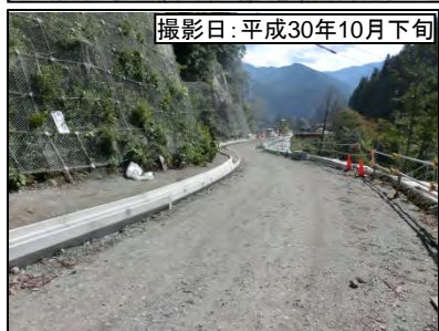
撮影日:平成30年10月下旬