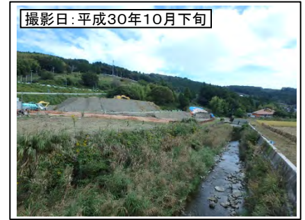
④菊川IC付近(東京方面を望む)