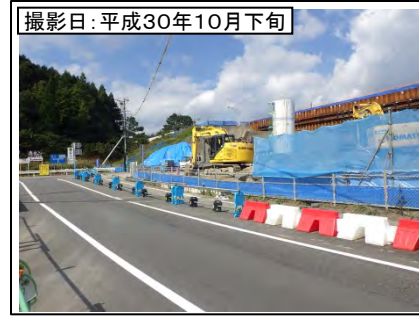
③菊川IC付近(名古屋方面を望む)