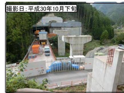
⑥ 3号トンネル東栄側