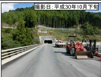
撮影日:平成30年10月下旬