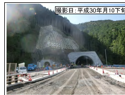
撮影日:平成30年10月下旬