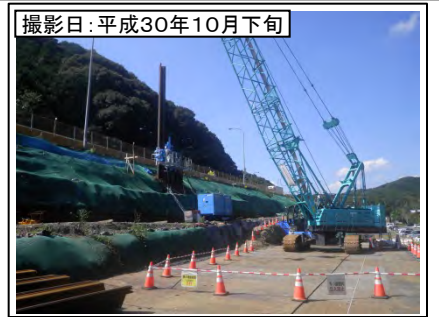
⑧野田IC付近(名古屋方面を望む)