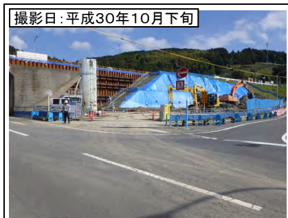
②菊川IC付近(東京方面を望む)