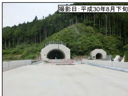
②佐久間第1トンネル(仮称)東栄側