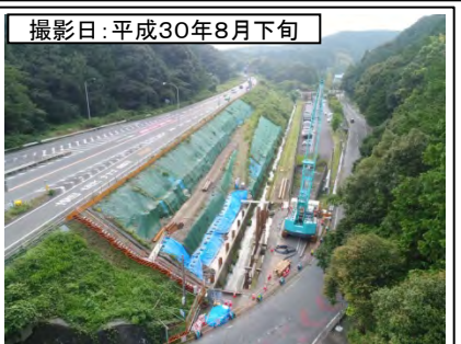
⑦野田IC付近(名古屋方面を望む)