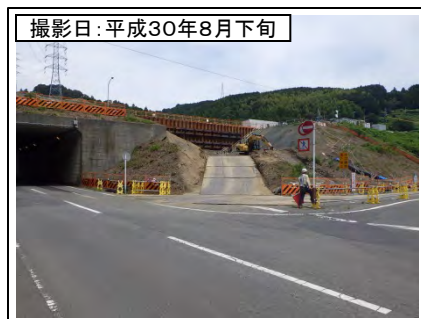
②菊川IC付近(東京方面を望む)