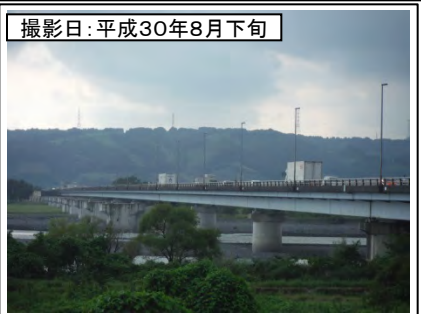
⑥新大井川橋左岸より