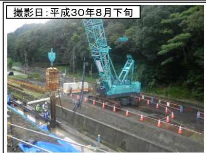
⑧野田IC付近(名古屋方面を望む)