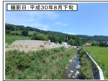
④菊川IC付近(東京方面を望む)