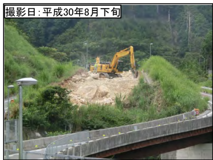
① 9号橋 (仮称)