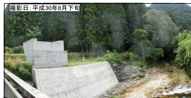
③ 8号橋 (仮称)