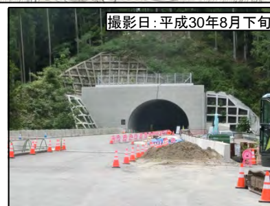
⑦佐久間第2トンネル(仮称)佐久間側坑口