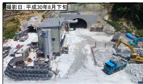
⑤ 3号トンネル新城側