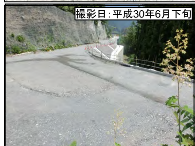
⑤浦川IC(仮称)左岸連絡路