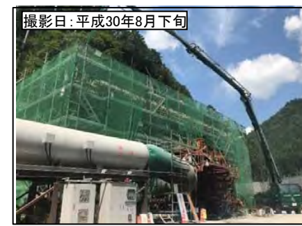
⑥ 3号トンネル東栄側