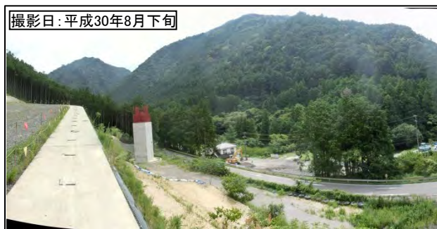
④ 7号橋 (仮称)