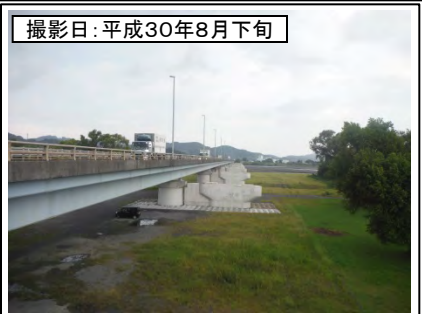
⑤新大井川橋右岸より