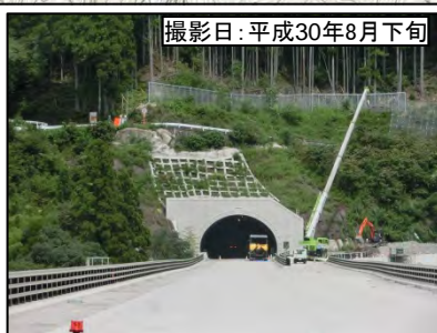
⑥佐久間第2トンネル(仮称)浦川側坑口