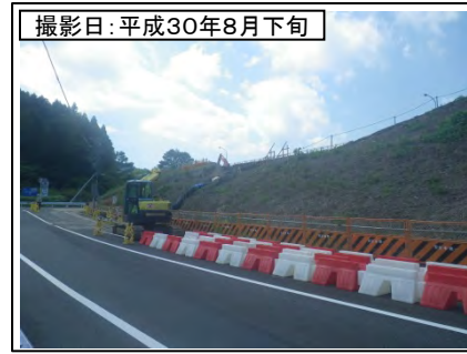
③菊川IC付近(名古屋方面を望む)