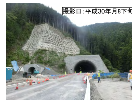
④佐久間第1トンネル(仮称)浦川側坑口