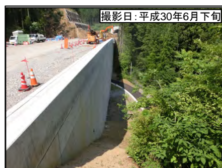
③東栄IC(仮称)補強土壁