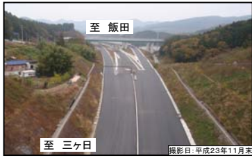
① 浜松いなさJCT 現況