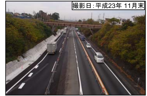
撮影日:平成23年 11月末