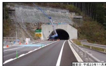
⑥ 名号トンネル(仮称) 引佐側坑口