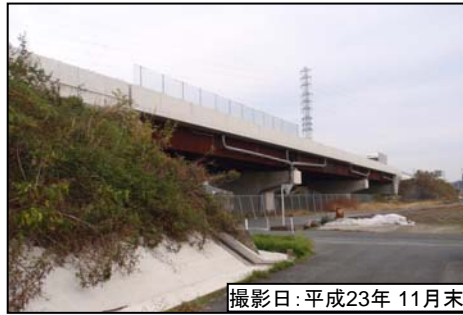
撮影日:平成23年 11月末