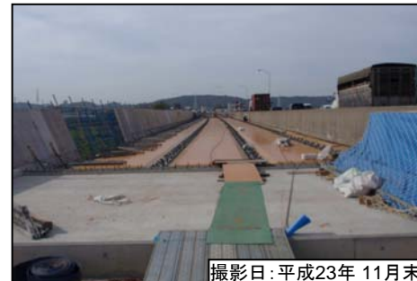
撮影日:平成23年 11月末