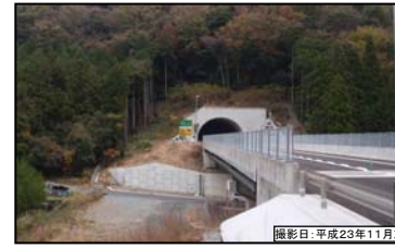
③ 久井田高架橋(仮称)久井田トンネル(仮称)