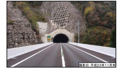
④ 三遠トンネル(仮称)飯田側坑口