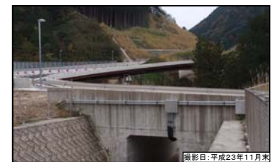
⑧ 鳳来I.C. ランプ橋(仮称)