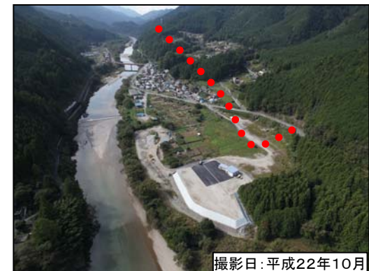
③ 佐久間 I C 現況