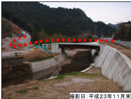
① 東栄 I C 現況