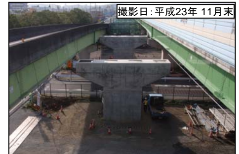
撮影日:平成23年 11月末