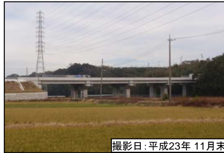
撮影日:平成23年 11月末