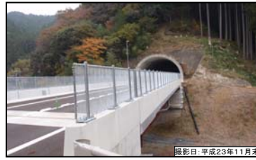
② 別所8号橋(仮称) 別所トンネル(仮称)