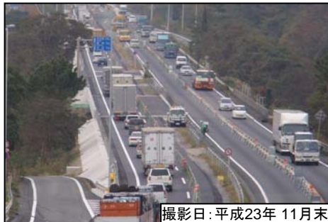
撮影日:平成23年 11月末