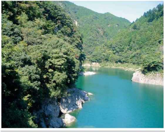
原田橋付近のようす (H18.10.12撮影)