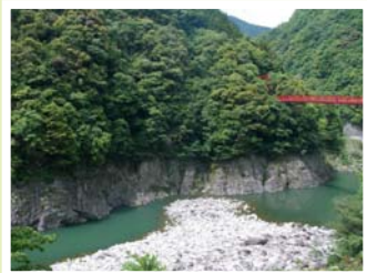
飛竜橋付近の景観

イワヒバ、ヤシャゼンマイ、コショウノキ、ヤマイワカガミ、ミツバツツジ、サツキ、リンドウ、イワタバコ、イワギボウシ、ヤマユリ、シュラン