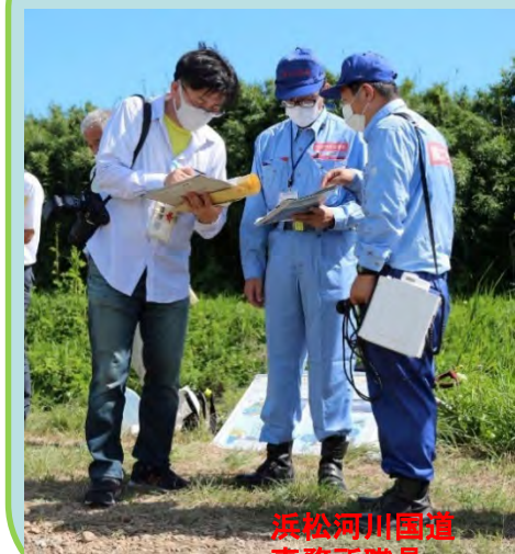
浜松河川国道事務所職員