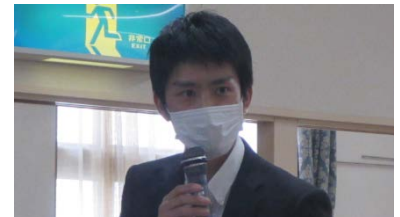
国土交通省 中部地方整備局 河川部 河川計画課長