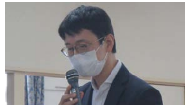
国土交通省 中部地方整備局 浜松河川国道事務所長