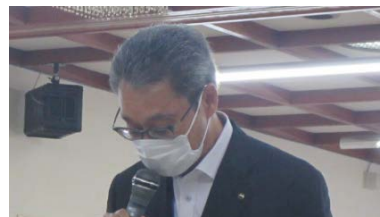
静岡県 袋井土木事務所長