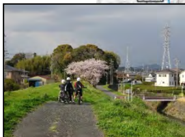
サイクリング(活用イメージ)