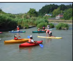
カヌー&SUP(活用イメージ)