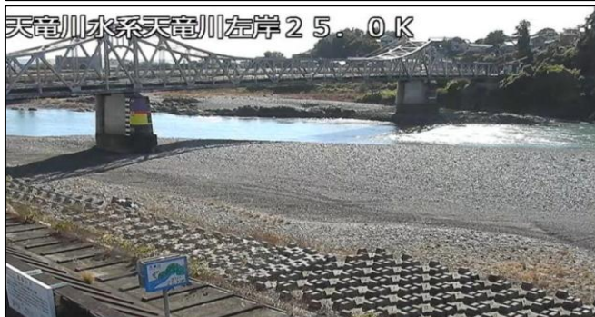
浜松市天竜区二俣町鹿島