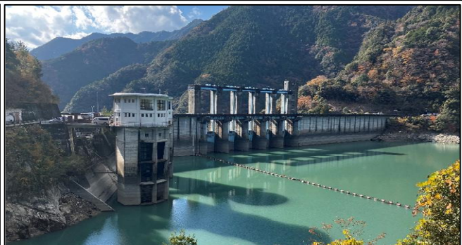
令和7年12月1日時点(佐久間ダム水位約27m)