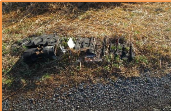
・キャタピラー？らしき物