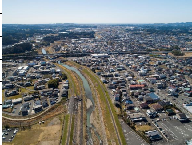
【仲島橋一万田第2樋管】