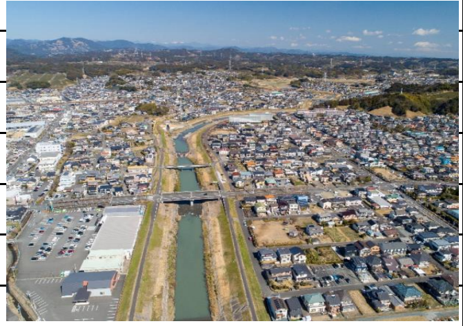
【万田第2樋管-仲島橋】