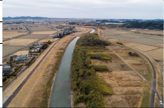
【高田橋南～大船渡橋】