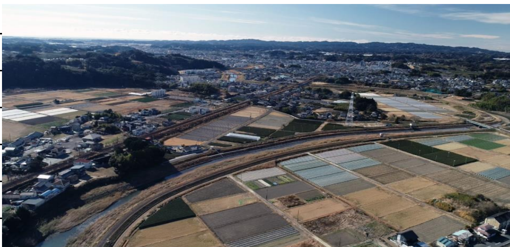
【立ヶ谷橋－潮海寺橋】