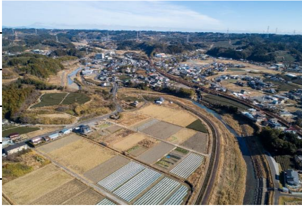
【潮海寺橋－立ヶ谷橋】