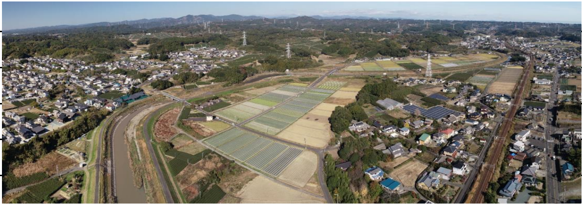
【矢田部橋～水神橋 (パノラマ)】

1. 本格的な冬到来。風の穏やかな日に調査してきました。矢田部橋から頭首工まで大きく湾曲しているのをパノラマに加工しました。