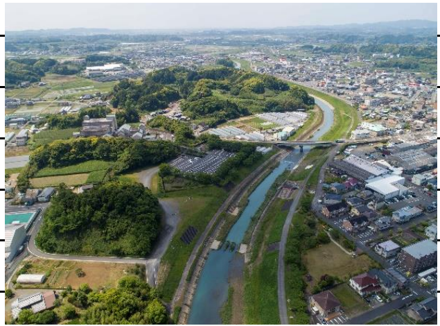
【アエル北～新菊川橋】