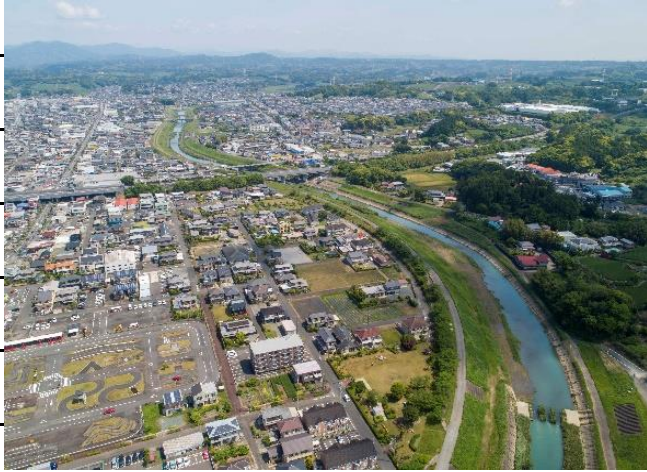
【新菊川橋～アエル北】