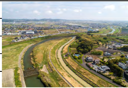
【大船渡橋～稲荷部川合流】

(1) 約15.8万㎡を調査して253枚の写真を使ったオルソ画像を作成しました。