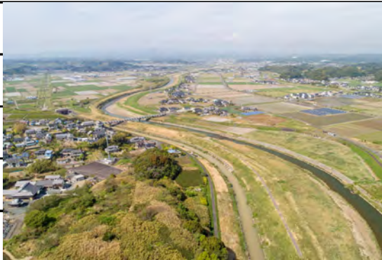
【稲荷部川合流～大船渡橋】

1. 菊川市の許可をいただいて、小笠グラウンドゴルフ場のある大船渡橋南側を調査してきました。