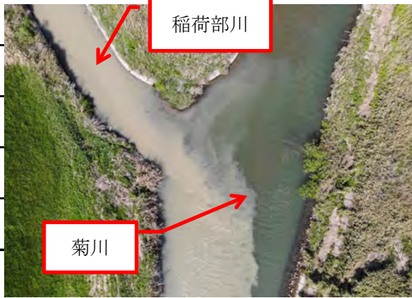
【稲荷部川合流点の可視写真】