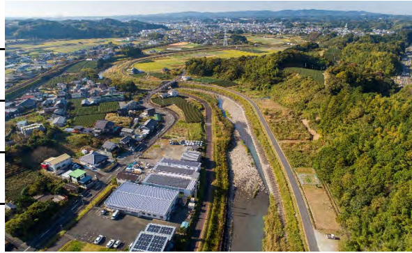
【立ヶ谷橋から頭首工】