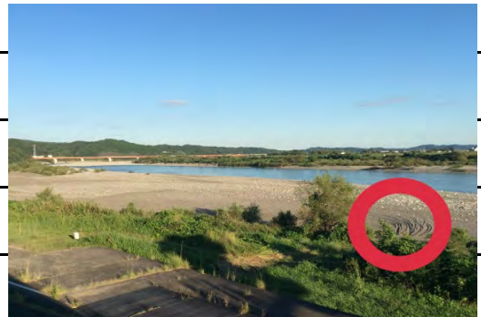
鹿島ひ管付近 進入口