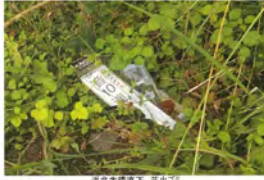
高北大橋下流 花火ゴミ