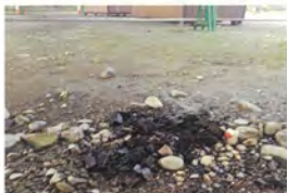
浜北大橋 橋直下BBQ跡

工事関係では、浜北大橋のメンテナンス工事が始まっていて看板の情報によると来年の2月25日まで行われるとのこと。