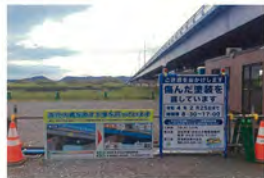
浜北大橋 工事看板