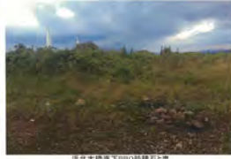
高北大橋下流 999跡残りゴミ