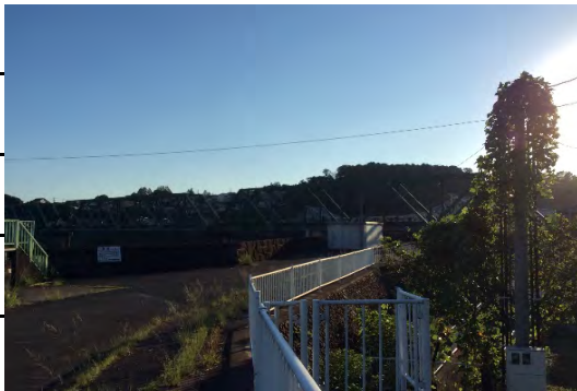
鹿島ひ管・電柱草・弦が巻き付いている電柱