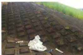
浜北大橋ゴミ 橋直下浜北側排水及行送