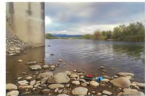
浜北大橋直下浜北側溜まり生活ゴミ