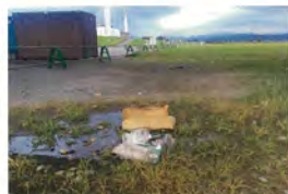
浜北大橋ゴミ 橋直下浜北側