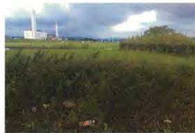
浜北大橋直下から江側