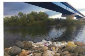
浜北大橋直下浜北側溜まり生活ゴミ3