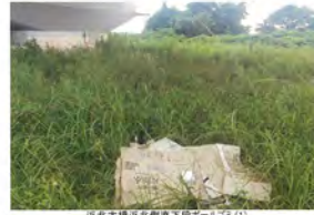
高北大橋洪水橋下流不ふゴミ(1)