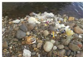
浜北大橋直下浜北側溜まり生活ゴミ2