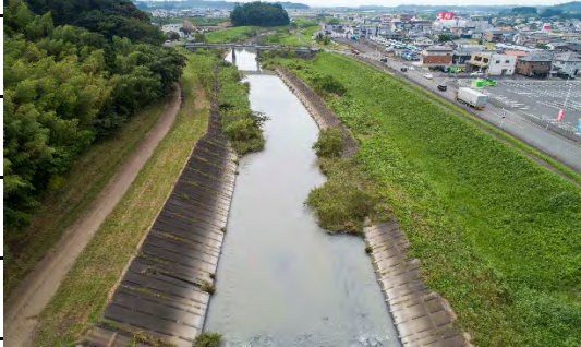
【新菊川橋から加茂橋】