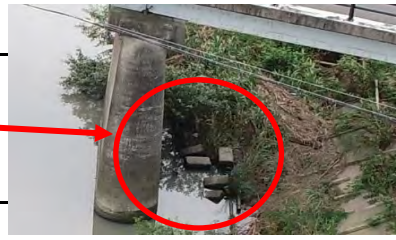
【右岸12.0km付近オルソ画像】