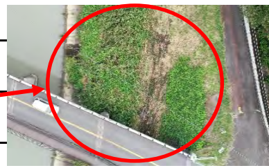
【左岸12.0km付近オルソ画像】