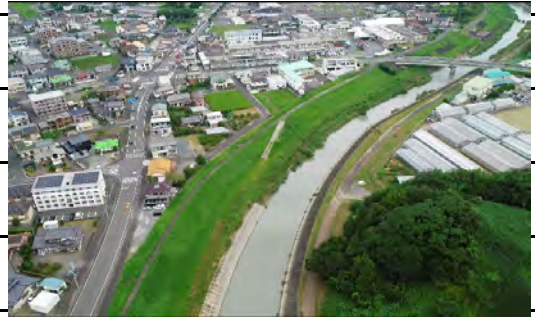
【加茂橋から新菊川橋】

2. 約200枚の写真を使って約9万㎡のオルソ画像を作成しました。長雨の後なのでまだ水が濁っています。(解像度約2cm/px)