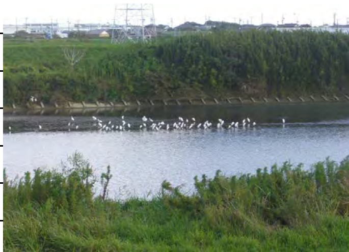
3. 菊川右岸 4.6km付近 国土強靱化対策工事（河道掘削工事）風景