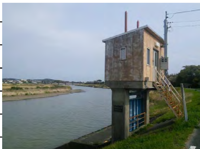
2. 左岸 国安水位観測所 付近風景