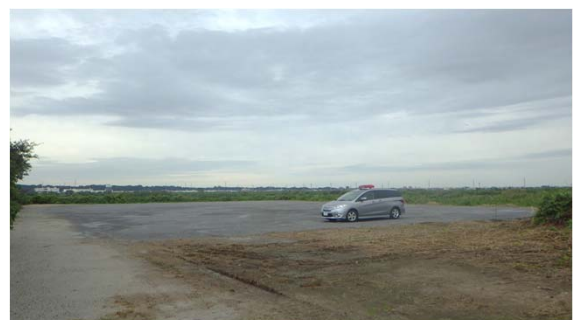
④ 突き当たりが引き渡し場所です