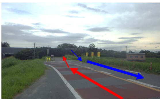
① 東名高速道路下流側を右折