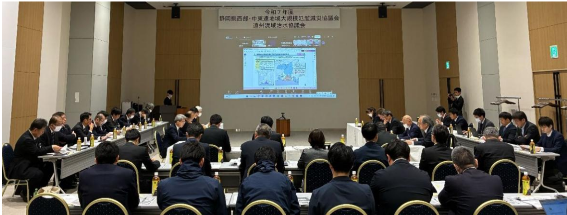
写真 会議の様子（会場）