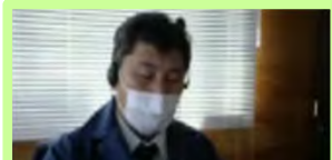
天竜森林管理署長