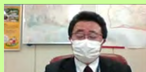
中遠農林事務所長