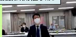
浜松河川国道事務所長