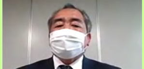
袋井土木事務所長