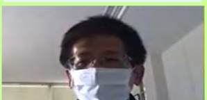
静岡地方気象台長