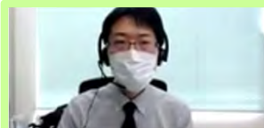
静岡水源林整備事務所長