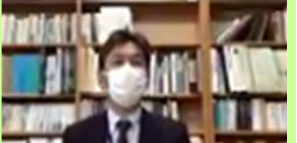
浜松土木事務所長