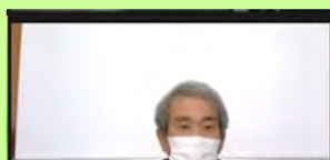
新城設楽建設事務所長