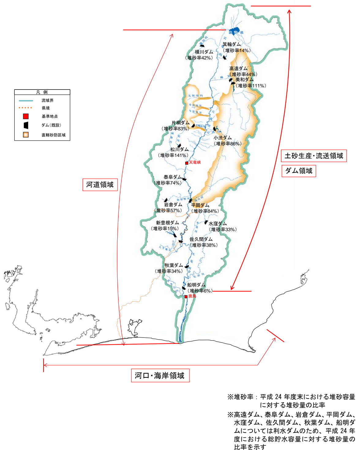
図 2-1 天竜川流砂系の範囲と領域