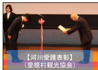
【河川愛護表彰】 (豊根村観光協会)