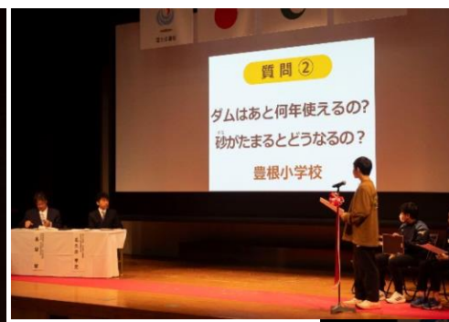
←ダムに関する質問