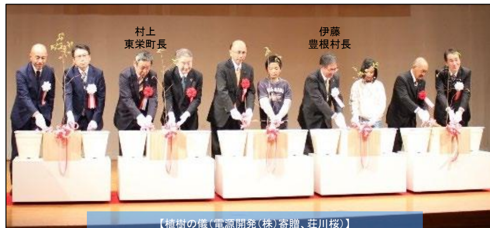
【植樹の儀(電源開発(株)寄贈、荘川桜)】