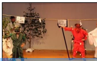
【花祭り】(下黒川花祭保存会)