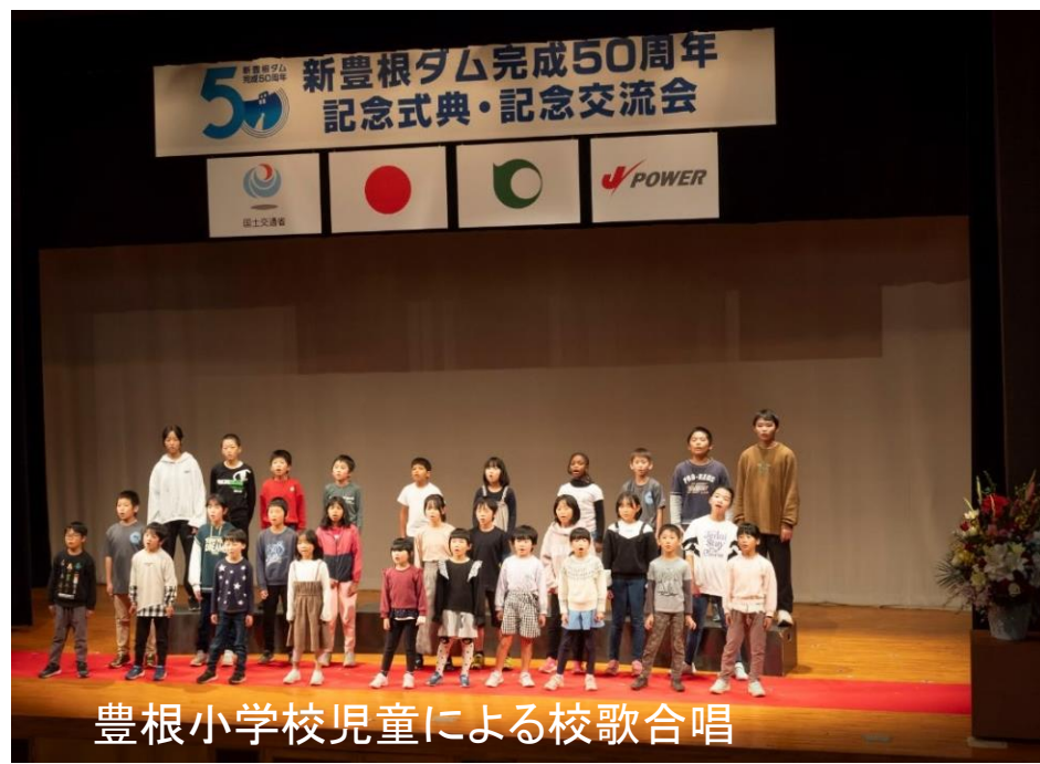
豊根小学校児童による校歌合唱