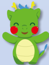
天竜川マスコットキャラ りゅっぴー