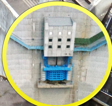
ゲート点検 ※お昼に1回実施