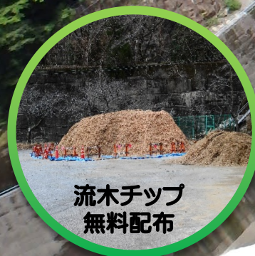
流木チップ 無料配布