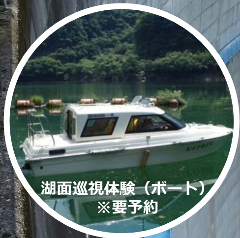
湖面巡視体験（ボート） ※要予約