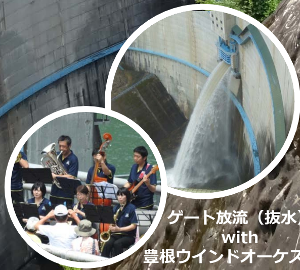
ゲート放流（放水） with 豊根ウインドオーケストラ