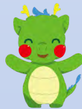
天竜川マスコットキャラ りゅっぴー