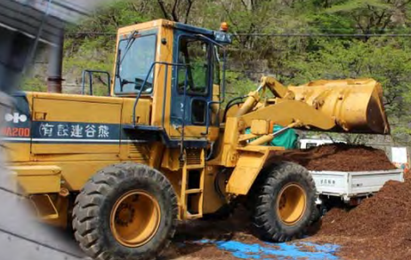
流木チップ化実施 チップ無料配布