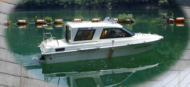
湖面巡視体験 (ボート)