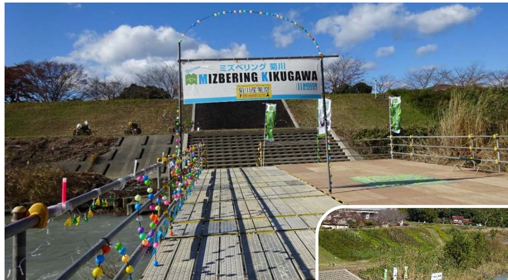
【水上ステージと臨時橋】

菊川市観光イベント実行委員会(菊川市観光協会/菊川市/菊川市商工会/JA遠州夢咲/菊川市茶業協会)