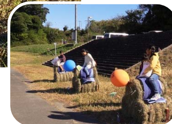
【堤防上のミズベアート(ベニヤ人)と干し草アート】