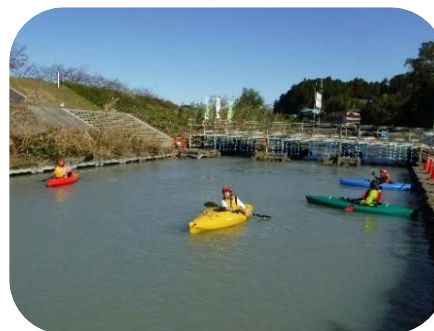
【菊川でプチカヌー体験】