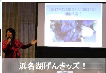
浜名湖げんきッズ!

それぞれのアイデアの実現に向けて具体的な内容のプレゼンをする各ユニットリーダー (通称:ミズベ戦隊)