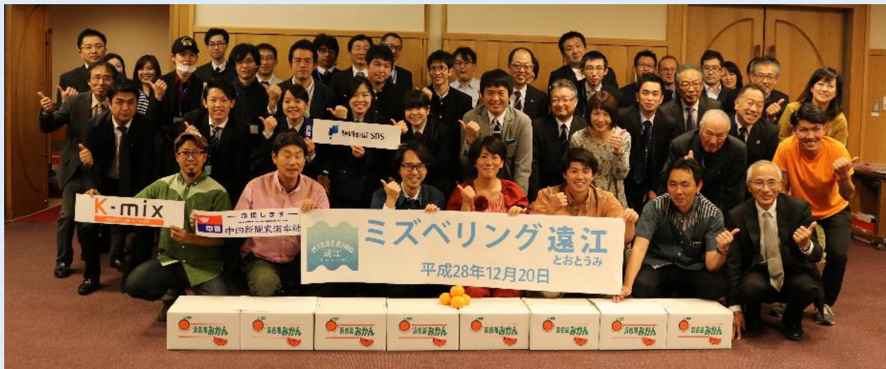
ミズベリング恒例集合写真 （みんなで「かき、みかん！ やらまいか！」）