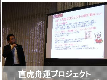
直虎舟運プロジェクト