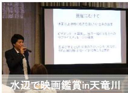
水辺で映画鑑賞in天竜川