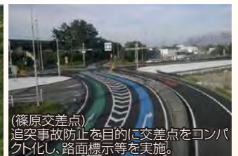
(篠原交差点) 追突事故防止を目的に交差点をコンパクト化し、路面標示等を実施。