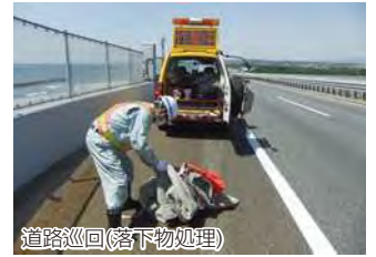
道路巡回(落下物処理)

道路に電気・水道・ガス等の施設を埋設したり、電線等の施設や突出看板等を設置する場合、また、民地から道路への自動車の乗り入れを設置する場合等について道路法に基づき、許可・承認の業務を実施しています。また、道路法に定められている一定の制限をこえる車両（特殊車両）を通行させる場合の許可業務を行っています。