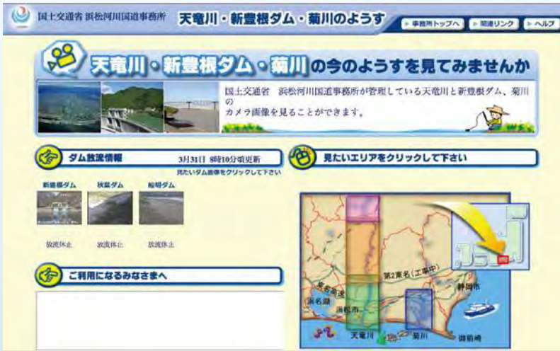
【浜松河川国道事務所 CCTVカメラ映像】で検索

「浜松河川国道事務所(下図)」や「国土交通省 川の防災情報(右図)」では、河川の水位や映像をパソコンやスマートフォン等で確認できます。