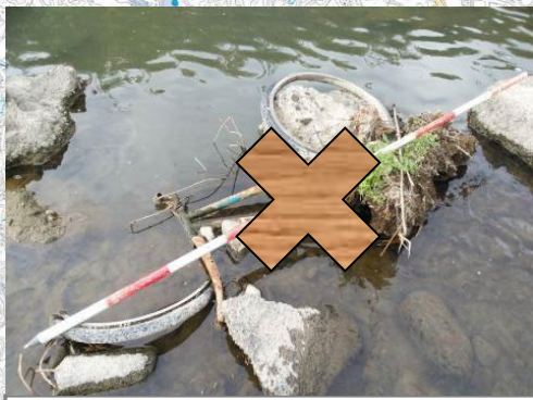
菊川低水路10.8k-80m: 自転車