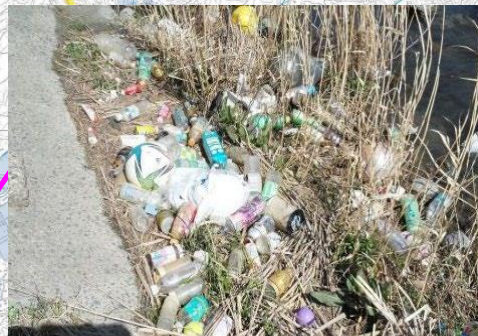
牛淵川左岸3.2k-20m: ペットボトル・缶など