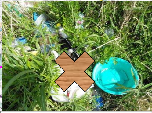
菊川左岸0.4k-90: 家庭ゴミ