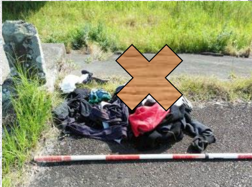
菊川左岸7.6k+100m: 衣類など