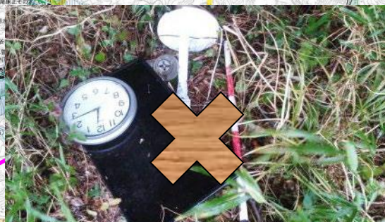
牛淵川左岸8.2k+70m: テレビ、時計、扇風機、ミキサー