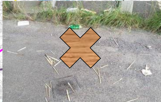
菊川左岸12.6k-50k: BBQ後のゴミ