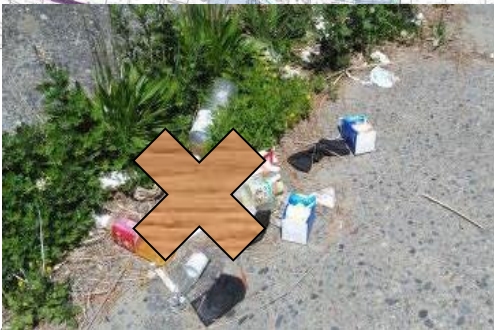
菊川右岸0.8k: 家庭ゴミ