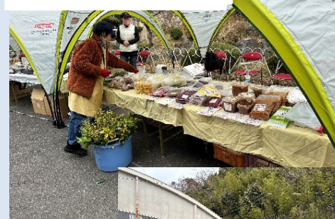
出張さくマルシェの様子