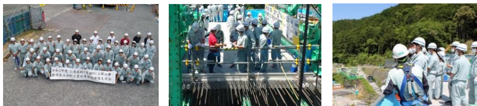
現場見学のイメージ(写真は今年度実施した別の見学会のもの)