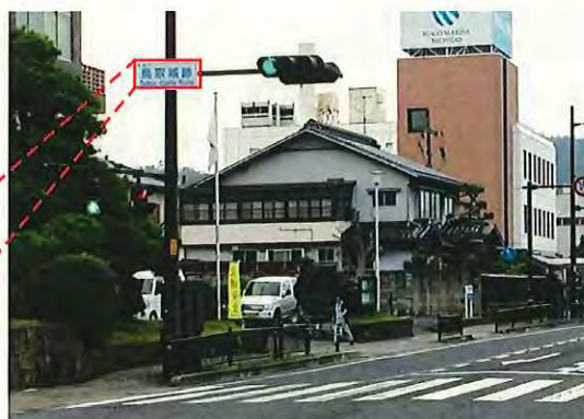
国道53号鳥取県鳥取市東町