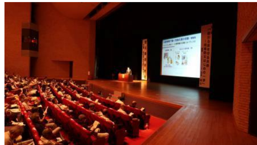
浜松市自主防災隊連合会 第1回防災委員研修会