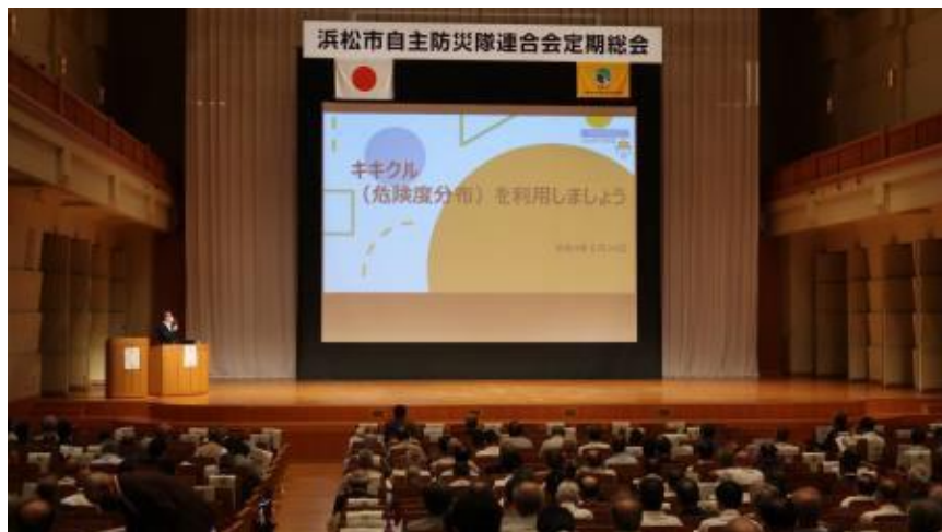
浜松市自主防災隊連合会定期総会