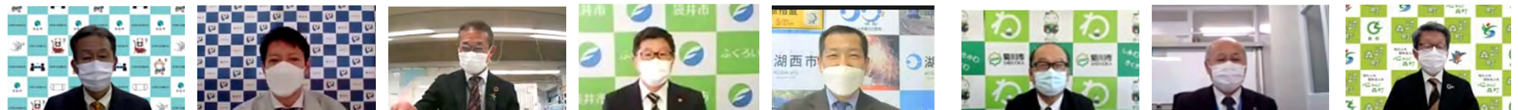
浜松市 危機管理監 磐田市 市長 掛川市 危機管理監 袋井市長 湖西市 市長 菊川市長 御前崎市 危機管理部長 兼危機管理監 森町 町長