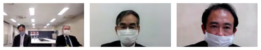
電源開発株式会社 中部支店長 遠州鉄道株式会社 鉄道営業所長 天竜浜名湖鉄道株式会社 常務取締役

参加機関:20機関 自治体関係:浜松市、磐田市、掛川市、袋井市、湖西市、御前崎市、菊川市、森町 静岡県関係:危機管理部、経営管理部西部地域局、健康福祉部政策管理局長、 交通基盤部河川砂防局、浜松土木事務所、袋井土木事務所 国関係 : 浜松河川国道事務所、中部運輸局(オブザーバー) 関係団体 : 気象庁静岡地方气象台、電源開発株式会社中部支店、 遠州鉄道株式会社、天竜浜名湖鉄道株式会社