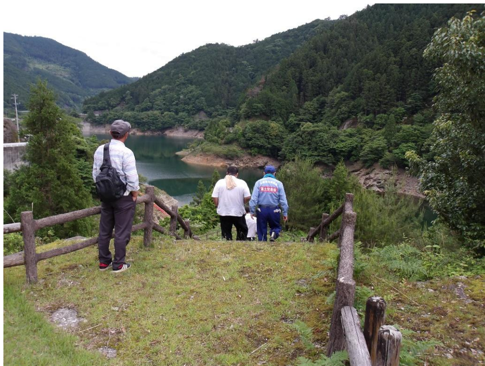
ダム湖周辺の点検