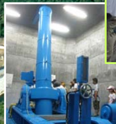
ゲートの開閉機です