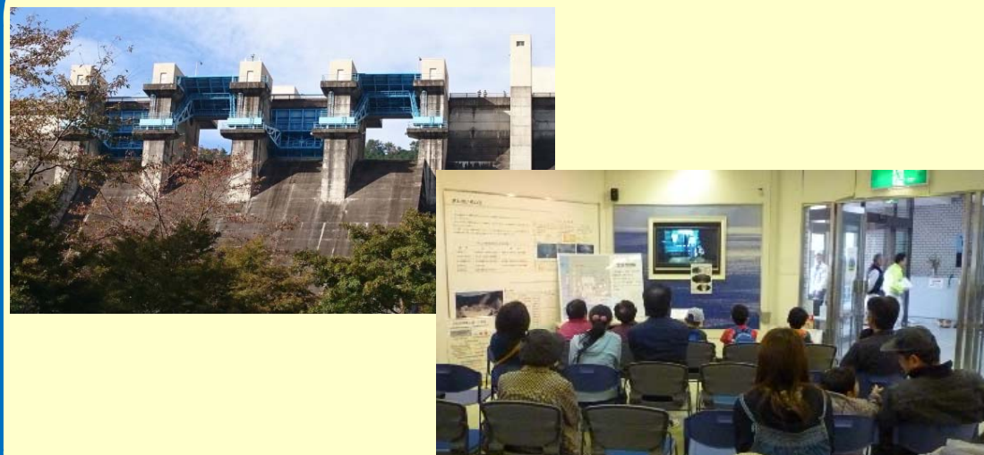
イベント中は特別にクレスト（非常用）ゲート1号と3号を開けるとともにゲート点検の様子をDVDにして放映しました。ダム愛好家に大好評！