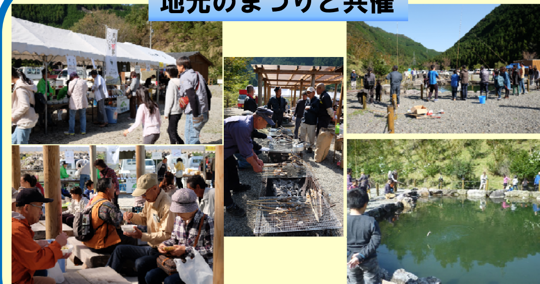
地域の方と協働して、木場公園でふれあいまつりを同時開催しました。 アマゴ釣りや地域の特産品販売など、多くの方で賑わいました。