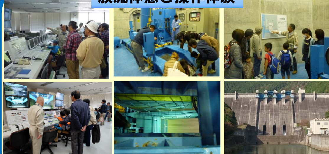
参加者の方々には、普段は出来ない様々な体験を楽しんで頂きました。 (写真 左：操作体験、中：放流体感、右：機械室での説明と下流状況)