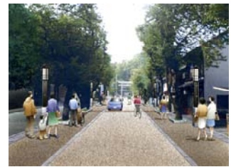
整備された町家形式（古川地区）