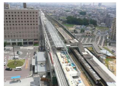
J R 東海中央本線連続立体交差事業（勝川駅付近）