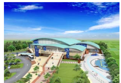
H21日本選手権水泳競技大会開催 会場イメージ（遠州灘海浜公園）