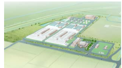
日光川下流浄化センターイメージ