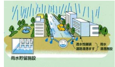
どいち 土市雨水貯留管等の整備（名古屋市瑞穂区）