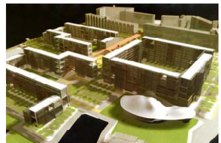
県営北方住宅イメージ