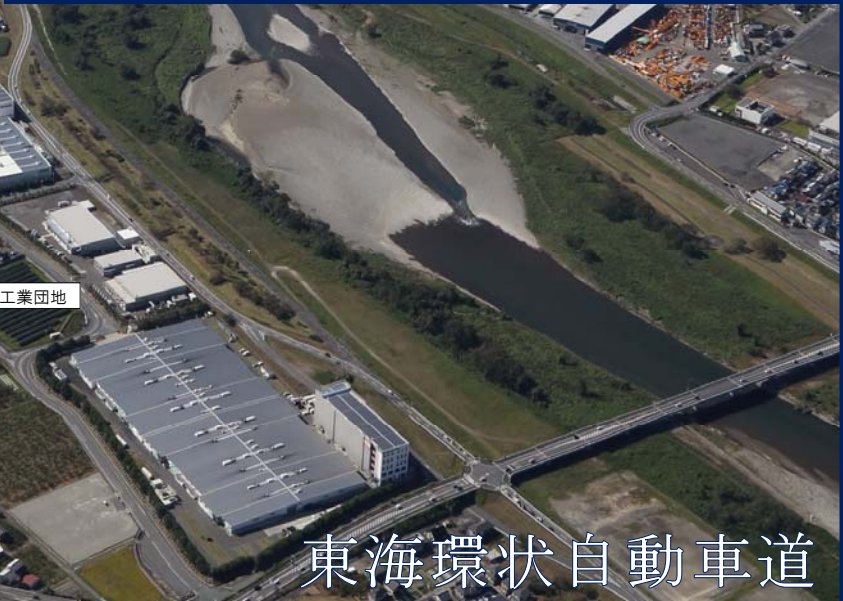
東海環状自動車道