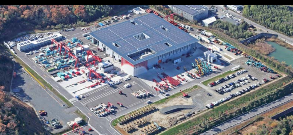
交通基盤が決め手で沿線に立地した(株)アクティオ(建設機械レンタル企業)(三重県いなべ市)